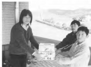
川場小学校の皆さん