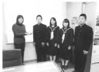
川場中学校の皆さん