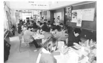
女性ボランティア講座