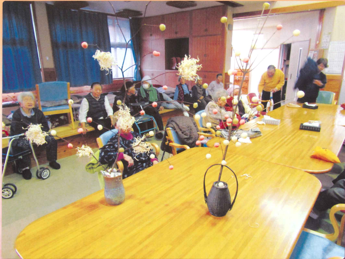
デイサービス 繭玉作り

〒378-0101 群馬県利根郡川場村大字谷地3086-1 TEL (0278) 50-1122 e-mail:kawaba-shakyo@po.kannet.ne.jp FAX (0278) 50-1123