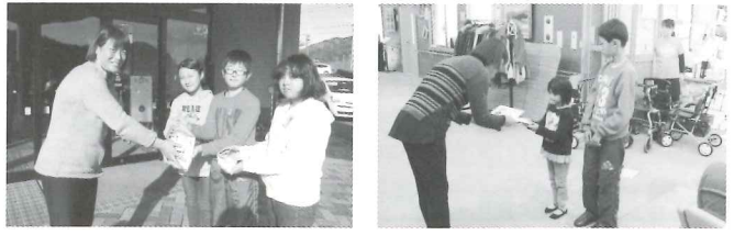
川場小学校の皆さん

赤い羽根共同募金は、毎年10月1日～12月31日を運動期間とする「地域福祉のための募金」です。住民相互の支えあい、住み慣れた地域で安心して暮らせるよう地域福祉活動を支援します。集まった募金は、地域の社会福祉施設やボランティア団体が行う福祉サービス事業、社会福祉協議会が実施する事業など、民間の社会福祉に役立てられます。